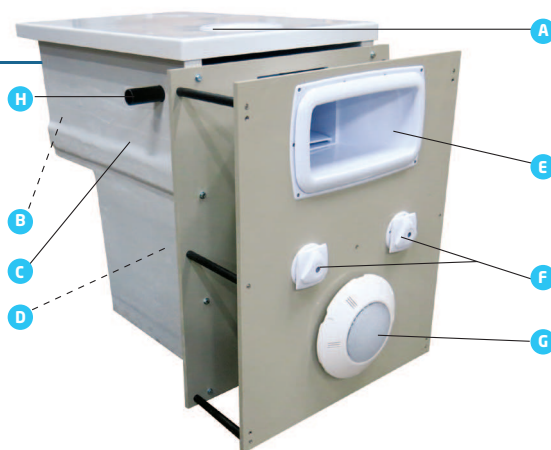
Schéma de principe d'un GS14 E