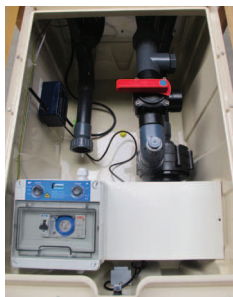
Schéma de principe d'un MX COO VT