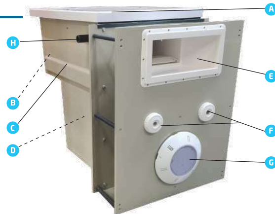
Schéma de principe