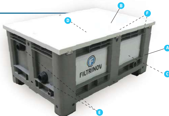
Schéma de principe