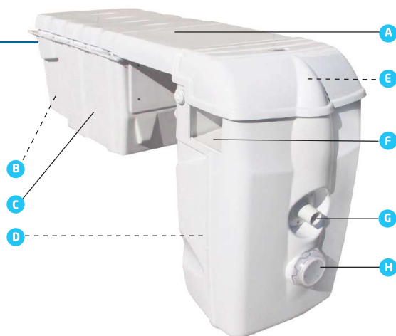
Schéma de principe