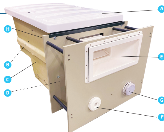
Schéma de principe